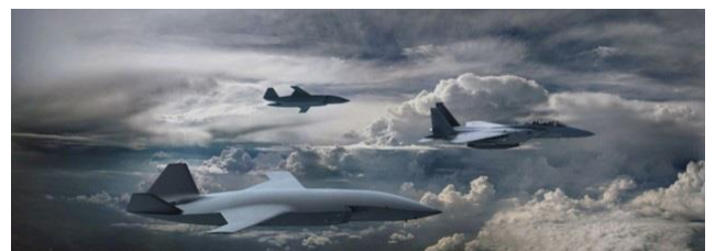
Ilustración 12: del artículo

Con una capacidad de carga útil de 29 500 libras (13 300 kg), incluidas armas de gran tamaño, el F-15EX ofrece una masa asequible para hacer frente a amenazas en rápida evolución. Cuando esta carga útil se combina con alcance, sensores modernos y un conjunto avanzado de guerra electrónica, el F-15EX presenta a los adversarios de su misma categoría múltiples desafíos tanto dentro como fuera de los círculos de amenaza. El F-15EX, que ofrece la mejor carga útil, alcance y velocidad de su clase, servirá como columna vertebral para cualquier flota de cazas tácticos, hoy y en el futuro. Basándose en un legado de dominio aéreo, el F-15EX combina su récord de combate invicto con diseño y tecnología de vanguardia, para ofrecer capacidades de última generación que lo impulsan directamente hacia el futuro del combate.