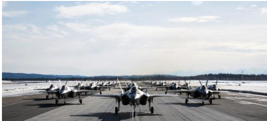
Ilustración 13: fotografía de la Fuerza Aérea de EE. UU. por el aviador de primera clase José Miguel T. Tamondong

Una versión “truncada” del software Technology Refresh 3 ha permitido al Pentágono reanudar las entregas, aunque no se espera que un segundo parche del software (que haría que los aviones sean completamente capaces de combatir) esté disponible hasta al menos dentro de un año. Cediendo a las demandas operativas, el Pentágono ha aceptado la reactivación en las entregas de nuevos cazas furtivos F-35, aun cuando el problema que provocó la paralización no se ha resuelto por completo.