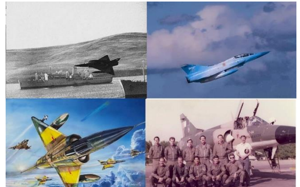
Ilustración 16: distintos momentos de los Mirage en Argentina

https://www.argentina.gob.ar/noticias/mirage-breve-resena-historica-del-gran-delta-argentino