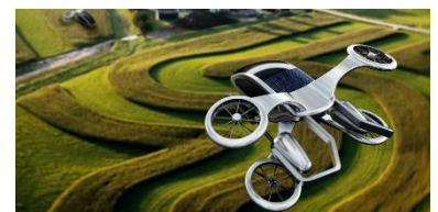
Ilustración 9: representativa de un avión eléctrico que será propulsado por la batería mejorada

Los biólogos intentan comprender mejor los sistemas celulares y este enfoque también ha ayudado a mejorar las baterías de litio para aviones eléctricos. La incapacidad de las baterías de litio para proporcionar alta potencia durante períodos prolongados no era un problema del ánodo, como se creía, sino que la causa principal era el cátodo y mezclar sales en el electrolito podría suprimir la reactividad.