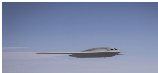
Ilustración 2: aviones B-21 de producción inicial a pequeña escala

En un documento del 7 de agosto de 2024, el Instituto de Asuntos Públicos (IPA) proporcionó seis recomendaciones que, según afirmó, Australia debería llevar a cabo. Una de estas era la adquisición del B-21 Raider, "como un elemento adicional" a la iniciativa trilateral de defensa y seguridad AUKUS que están llevando a cabo Australia, Estados Unidos y el Reino Unido. La compra propuesta por Australia del B-21 Raider serviría para proporcionar un elemento de disuasión no nuclear de largo alcance, con mayor rapidez que con los submarinos de ataque de propulsión nuclear (SSN) de AUKUS, que entrarán en servicio a principios de la década de 2040. Antes de eso, Australia arrendará hasta cuatro SSN de clase Virginia a la Armada de los Estados Unidos, como medida provisional.