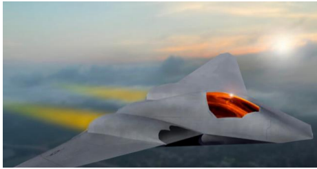
Ilustración 3: del artículo

El programa secreto de aviones X de varias agencias explora futuros cazas que allanan el camino para el programa de Dominio Aéreo de Próxima Generación, reveló el secretario de la Fuerza Aérea, Frank Kendall, en la Cumbre de Defensa de POLITICO . Aunque Kendall y otros oficiales de la Fuerza Aérea han dicho anteriormente que había prototipos voladores antes de la etapa actual del programa NGAD, sus nuevos comentarios proporcionaron más detalles sobre el proyecto altamente clasificado, incluidas las agencias involucradas, parte del dinero gastado y el hecho de