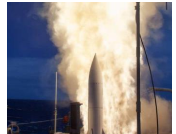
Ilustración 14: Raytheon Technologies

https://spacenews.com/x-bow-raises-70-million-to-boost-solid-rocket-motor-production/ https://spacenews.com/anduril-gets-19-million-contract-to-develop-solid-rocket-motors-for-u-s-navy/