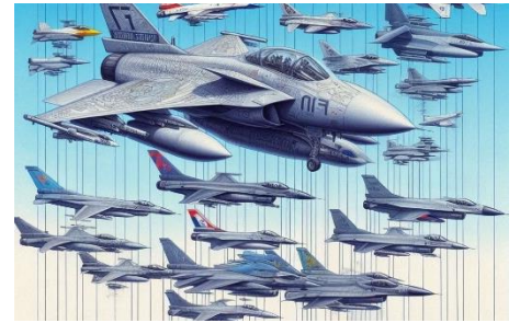
Ilustración 1: generada por IA Copilot

Las diferencias en el desarrollo aéreo de la región son marcadas por lo que el liderazgo de este país de Sudamérica resulta aún más notorio con la posesión, incluso de aviones de combate de última generación. En el ranking de poder aéreo de Sudamérica, Brasil se sitúa en una posición destacada, con una flota que cuenta con más de 600 aviones de guerra. La cifra consolidó a este país de Sudamérica como el principal actor en el ámbito aéreo de la región. El lugar alcanzado por Brasil resulta aún de mayor envergadura, si se tiene en cuenta que, en Latinoamérica, la capacidad de las fuerzas aéreas varía considerablemente entre los países.