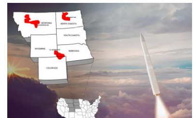
Ilustración 6: del artículo

El misil balístico intercontinental Sentinel sustituye al antiguo misil balístico intercontinental LGM-30G Minuteman III, un misil de tres etapas con combustible sólido que lleva hasta tres ojivas nucleares Mk 12A con objetivos independientes. El Minuteman fue diseñado en la década de 1960, desplegado en la de 1970, y se esperaba que no estuviera en servicio hasta la década de 1980. Ya lleva cincuenta y cuatro años en servicio (y sigue sumando) y se prevé que será reemplazado a principios de la década de 2030.