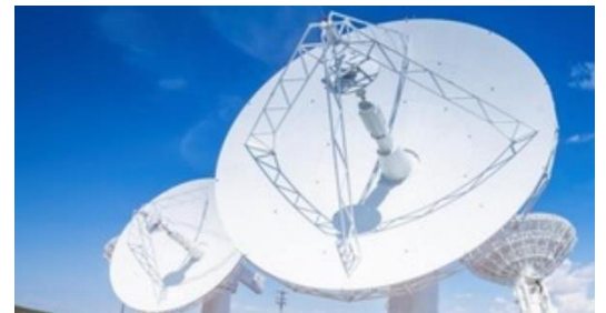
Ilustración 4: del artículo (Ministerio de Defensa RUGBIN)

Esta estrategia establece las ambiciones del gobierno para el Reino Unido en el espacio, uniendo por primera vez la política civil y de defensa. Esta primera Estrategia Espacial Nacional reúne las fortalezas del Reino Unido en materia de ciencia y tecnología, defensa, regulación y diplomacia, para perseguir una visión nacional audaz. La estrategia identifica cinco objetivos y las actividades que el gobierno, el mundo académico y la industria deberán llevar a cabo para alcanzarlos. El proyecto Deep Space Advanced Radar Capability (DARC) contempla la construcción de veintisiete antenas de radar, cada una de ellas de 20 metros de altura, en la península de St. David. Estos radares de alta tecnología están diseñados para rastrear objetos tan pequeños como un balón de fútbol y forman parte de una red global más amplia destinada a mejorar la defensa espacial. El sistema de radar es una iniciativa clave en el marco de la asociación de defensa Aukus, en la que participan el Reino Unido, los Estados Unidos y Australia. La red se extenderá por tres países y está destinada a vigilar y rastrear objetos a una distancia de hasta 36 000 kilómetros de la Tierra.