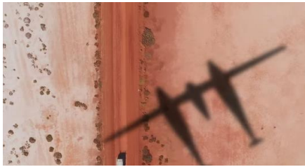
Ilustración 7: imagen de https://www.youtube.com/watch?v=dqkg6Ecv6G8&t=13s

La principal dificultad de este proyecto es preservar el estado del hidrógeno líquido a una temperatura extremadamente baja, cercana al cero absoluto, durante nueve días. El avión, llamado Climate Impulse , está diseñado para volar sin escalas alrededor del Ecuador en solo nueve días, propulsado únicamente por hidrógeno verde.