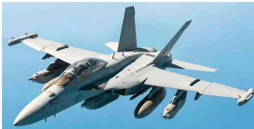
Ilustración 8: del artículo

Utilizando una combinación de IA y tecnología de última generación, el Ejército Popular de Liberación (EPL) ha demostrado que puede superar los sistemas de guerra electrónica estadounidenses. Los investigadores chinos han revelado cómo la "red de destrucción" de la Armada del EPL fue capaz de derrotar a los sistemas de guerra electrónica (EW) EA-18G "Growler" de la Armada de los Estados Unidos. Destacados en un artículo revisado por pares y publicado el mes pasado en la revista académica china Radar & ECM , los científicos explicaron cómo la inteligencia artificial (IA) jugó un papel crucial.