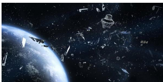
Ilustración 15: imagen representativa de desechos espaciales alrededor de la Tierra

El 6 de agosto del corriente, China entró en la carrera de las megaconstelaciones. Un cohete chino Long March colocó con éxito los primeros dieciocho satélites en la órbita baja terrestre de la megaconstelación planificada de Qianfan. Poco después del lanzamiento, la etapa superior del cohete se desintegró. La nube de escombros resultante, ahora en órbita sobre nuestro Planeta, representa una grave amenaza para otros satélites y misiones futuras.