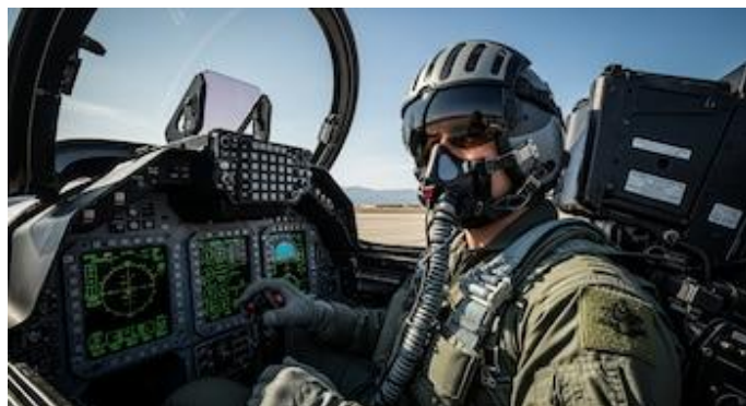
Ilustración 2: imagen ilustrativa de Infobae

La retención de personal militar cualificado —tanto tropa como oficiales— es fundamental para preservar la moral y la operatividad de las unidades, así como para evitar los costes asociados a la formación de personal de reemplazo en habilidades esenciales. La Fuerza Aérea de los Estados Unidos se enfrenta a una crisis de retención de pilotos que ha dejado vacantes aproximadamente 1800 puestos de piloto, mientras que las aerolíneas comerciales contratan a 7600 pilotos con formación militar cada año y ofrecen bonos de contratación de 7500 dólares. La brecha salarial entre la aviación militar y la comercial se ha ampliado hasta el punto de que un capitán sénior de aviones de fuselaje ancho en United, Delta o American Airlines puede ganar entre 450.000 y 550.000 dólares anuales, más del doble del límite salarial base de 200.000 dólares para los pilotos de la Fuerza Aérea, independientemente de su rango o experiencia.