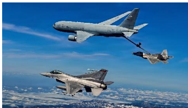
Ilustración 6: KC-46 Pegasus reabastece de combustible a un F-22 Raptor y un F-16 espera su turno sobre el desierto de Mojave, el 3 de marzo de 2026

El reabastecimiento aéreo de combustible es una de las pruebas operativas más difíciles en el desarrollo de armamento; no se trata de una oportunidad para tomar fotografías, sino del momento en que se descubre si una aeronave realmente funciona dentro de una fuerza de combate en condiciones reales. La Fuerza Aérea de EE.UU. ha recibido 105 aviones cisterna de reabastecimiento aéreo Boeing KC-46 Pegasus sin haber certificado completamente el programa como operativo, a pesar de tener tres deficiencias activas de Categoría 1. Esta es la designación de problema más grave del Pentágono, reservada para fallas que comprometen directamente la capacidad de una aeronave para ejecutar su misión, según el analista de defensa Dr. Andrew Latham del Macalester College. Y el nuevo B-21 Raider depende de este avión cisterna para cumplir su cometido.