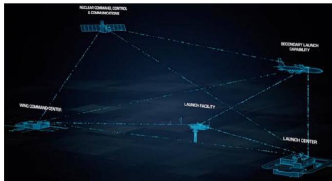
Ilustración 4: del video

Durante más de seis décadas, un elemento disuasorio estratégico seguro, fiable y eficaz ha sido la base de la seguridad nacional de Estados Unidos. Para estar a la altura del entorno de amenazas actual, Estados Unidos está liderando una modernización crucial del componente terrestre de la tríada nuclear actual, conocido como el misil balístico intercontinental Sentinel de la Fuerza Aérea de Estados Unidos. Este sistema, de alcance y complejidad históricos, que solo se presenta una vez en una generación, incluye un nuevo misil, una vasta capacidad de mando, control y comunicaciones, y cientos de proyectos de infraestructura, incluidas instalaciones reforzadas repartidas a lo largo de miles de kilómetros en cinco estados. El sistema Sentinel de última generación reemplaza al actual Minuteman III, que ha estado en servicio durante más de 50 años. Un equipo liderado por Northrop Grumman es el responsable de diseñar y producir la parte tecnológicamente más avanzada de este nuevo sistema de disuasión estratégica terrestre, diseñado para ser operativo hasta 2075.