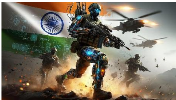
Ilustración 3: generada con IA (defencexp.com)

La transformación de la guerra moderna no es meramente táctica, sino fundamental, y exige una revisión de la doctrina militar, el derecho internacional y la propia naturaleza del poder estatal en el siglo XXI. A medida que la tecnología de precisión se vuelve más accesible y los sistemas autónomos más capaces, el desafío consistirá en mantener el control humano sobre la conducción de la guerra, preservando al mismo tiempo los principios humanitarios que han guiado las relaciones internacionales durante más de un siglo. La historia militar ha demostrado a