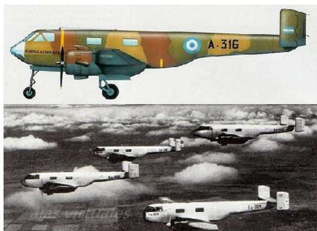
Ilustración 10: https://amilarg.com.ar/huanquero.html

Diseñado y construido íntegramente en la Fábrica Militar de Aviones de Córdoba, este bimotor marcó una época