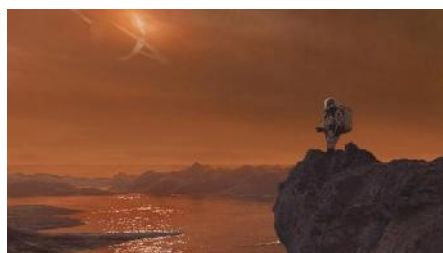
Ilustración 9: un explorador espacial disfruta del paisaje en Titán (Michael Carroll)

Tras "reiniciar" la Luna y establecer una base allí, y posteriormente enviar tripulaciones expedicionarias a Marte, ¿adónde debería ir la humanidad? El próximo mes, una reunión sin precedentes sentará las bases para una futura expedición tripulada a la fascinante Titán, la mayor de las numerosas lunas de Saturno. Esta cumbre inaugural, denominada "Cumbre Humana a Titán", defenderá la idea de una misión tripulada a esa lejana luna, detallando los objetivos científicos y los conceptos de las misiones humanas a Titán, así como los esfuerzos robóticos previos necesarios.