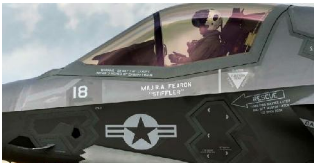
Ilustración 7: GaN, interferencias, SAR, fusión y drones: por qué el radar APG-81/APG-85 transforma al F-35 en un centro de combate Block 4.

El radar del F-35 ya no es solo un sensor. Se ha convertido en una herramienta versátil para detectar, identificar, mapear, proteger y, en ocasiones, neutralizar amenazas. En 2026, la transición del AN/APG-81 al AN/APG-85 cristaliza esta evolución. El cambio de material, de GaAs a GaN, no es un detalle industrial. Modifica la potencia disponible, la gestión térmica y el margen para nuevos modos de operación. Al mismo tiempo, la arquitectura de software compatible con TR-3 y Block 4 ofrece mayor flexibilidad para el procesamiento de señales y la fusión de datos. El resultado se aprecia en cinco áreas: alcance