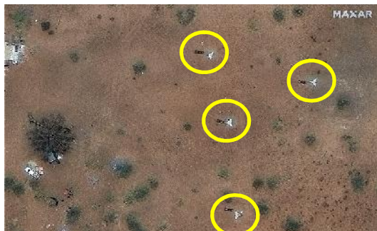
Ilustración 1: imagen satelital muestra drones suicidas de largo alcance y sus equipos de lanzamiento al norte del aeropuerto de Nyala, Sudán, el 6 de mayo de 2025.

Los conflictos actuales demuestran que los drones, las nuevas tecnologías y las armas de bajo coste están reconfigurando el campo de batalla moderno. En los últimos años, las fuerzas armadas han aumentado su dependencia de los drones para desplegar poder aéreo a baja altitud, evadiendo las defensas aéreas y permitiendo a los usuarios amplificar la velocidad, el alcance, la letalidad y el impacto psicológico de los efectos en combate. Estos avances sugieren importantes oportunidades para mejorar el poder aéreo a precios más bajos; sin embargo, el creciente uso de drones exige evaluaciones cuidadosas de sus capacidades y de los sistemas antidrones. Este documento examina el papel transformador de los drones pequeños y de bajo costo en la guerra del futuro, basándose en las lecciones