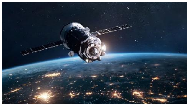
Ilustración 8: satélite en la órbita baja de la tierra

Dos naves espaciales rusas acaban de demostrar un conjunto muy particular de habilidades orbitales. Según COMSPOC, una empresa de software de conocimiento de la situación espacial con sede en Pensilvania, los satélites, conocidos como COSMOS 2581 y COSMOS 2583, se acercaron a tan solo 3 metros (10 pies) el uno del otro el 28 de abril. "No se trató de un sobrevuelo casual: COSMOS 2583 realizó varias maniobras precisas para mantener esta configuración tan ajustada", escribió COMSPOC en una publicación del 1 de mayo en X, que incluía una animación del encuentro.